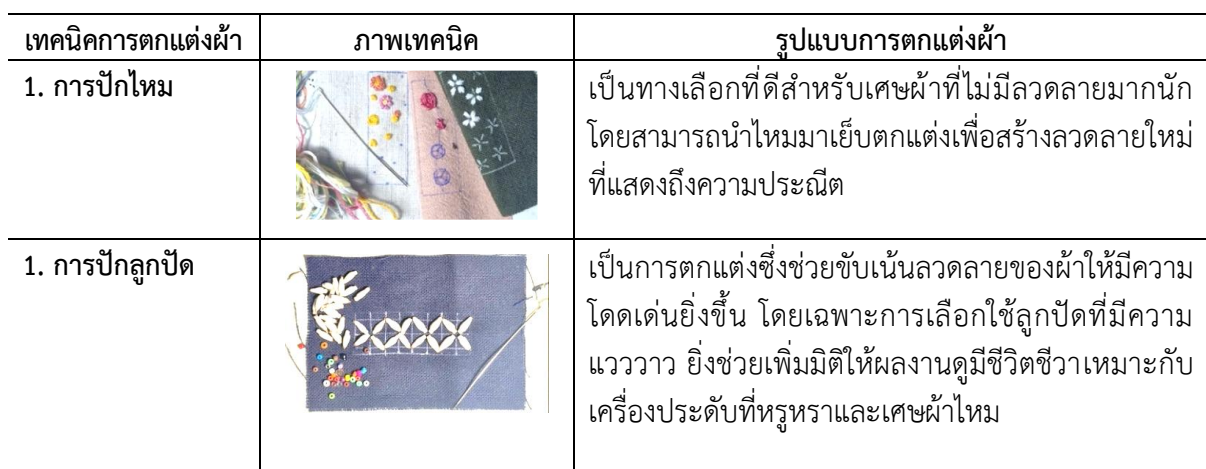
ตารางที่ 1 การศึกษาเทคนิคและกระบวนการสร้างสรรค์เศษผ้า