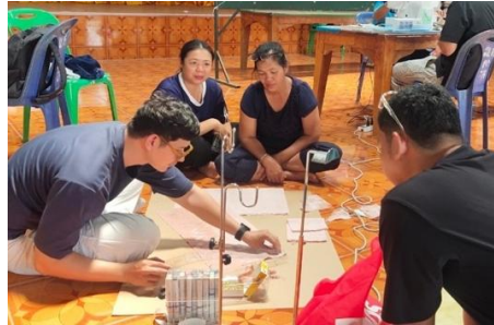
ภาพที่ 1 การสัมภาษณ์และลงพื้นที่วิสาหกิจชุมชนชีวิตวิถีสตรีบ้านซัปดาห์สอง

ประเด็นที่ 2 ทักษะของสมาชิกในชุมชนส่วนใหญ่เป็นงานเย็บเบื้องต้น การสอย และการปัก ลวดลายอย่างง่าย กลุ่มเป้าหมายมีความสนใจในการพัฒนาเศษผ้าเป็นเครื่องประดับที่ไม่ซับซ้อน ดังนั้น ผู้วิจัย จึงเสนอแนวทางการสร้างเครื่องประดับแฟชั่นจากชิ้นส่วนสำเร็จรูป โดยเลือกใช้อุปกรณ์คุณภาพดีเพื่อเพิ่ม มูลค่าและตอบโจทย์ลูกค้าที่มองหาเครื่องประดับของที่ระลึกที่สะท้อนอัตลักษณ์ท้องถิ่น จากข้อมูลการ สัมภาษณ์และสำรวจเศษผ้า ผู้วิจัยได้นำมาวิเคราะห์เพื่อต่อยอดการออกแบบเครื่องประดับจากเศษผ้าลาย ปัญจจินทบูร พร้อมวางแผนดำเนินงานในขั้นตอนถัดไป