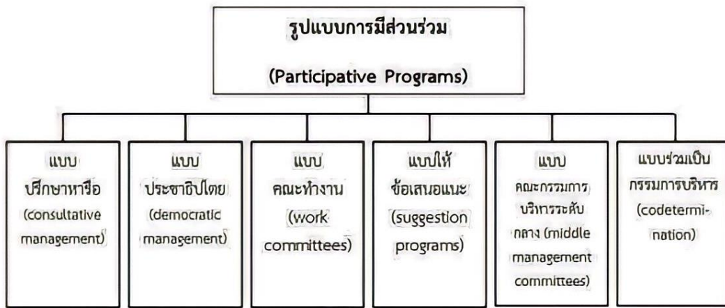
ภาพที่ 1 ประเภทของรูปแบบการบริหารแบบมีส่วนร่วม 6 รูปแบบ ที่มา: Keith Davis (1981, pp. 160-165)

การประชุมวิชาการและนำเสนอผลงานวิจัยระดับชาติ ครั้งที่ 5 วันที่ 3 เมษายน พ.ศ. 2566