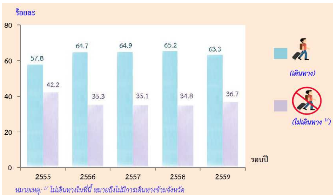
รูปภาพที่ 2 ร้อยละของประชากรที่มีอายุ 15 ปีขึ้นไปจำแนกตามการเดินทางท่องเที่ยวในรอบปี 2555-2559

จากการสำรวจพฤติกรรมการเดินทางท่องเที่ยวของชาวไทยปี 2560 ซึ่งเป็นการสำรวจประชากรที่มีอายุ 15 ปีขึ้นไปทั่วประเทศ เกี่ยวกับการเดินทางจากที่อยู่อาศัยประจำในจังหวัดหนึ่งไปยังสถานที่อยู่ในอีกจังหวัดหนึ่งเป็นการชั่วคราว โดยมีจุดประสงค์เพื่อการท่องเที่ยว พักผ่อน เยี่ยมครอบครัว/ญาติมิตร ประชุมหรือสัมมนา เล่นหรือดูกีฬา ไม่รวมการเดินทางไปทำงานหรือไปศึกษาเป็นประจำ พบว่ามีชาวไทยเดินทางท่องเที่ยวร้อยละ 63.3 และไม่เดินทางท่องเที่ยว ร้อยละ 36.7 แสดงดังรูปภาพที่ 2