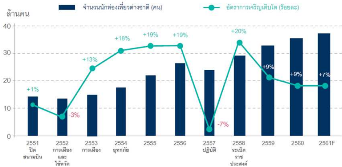
รูปภาพที่ 1 แสดงจำนวนนักท่องเที่ยวต่างชาติในแต่ละปีและอัตราการเจริญเติบโต