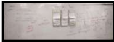
ภาพที่ 3 พบแนวปฏิบัติในการสังเกตแนวคิดนักเรียนสามารถเชื่อมกับหลักการทางคณิตศาสตร์ได้