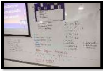
ภาพที่ 1 จะค้นพบแนวปฏิบัติในการเปรียบเทียบ แนวคิดที่หลากหลาย