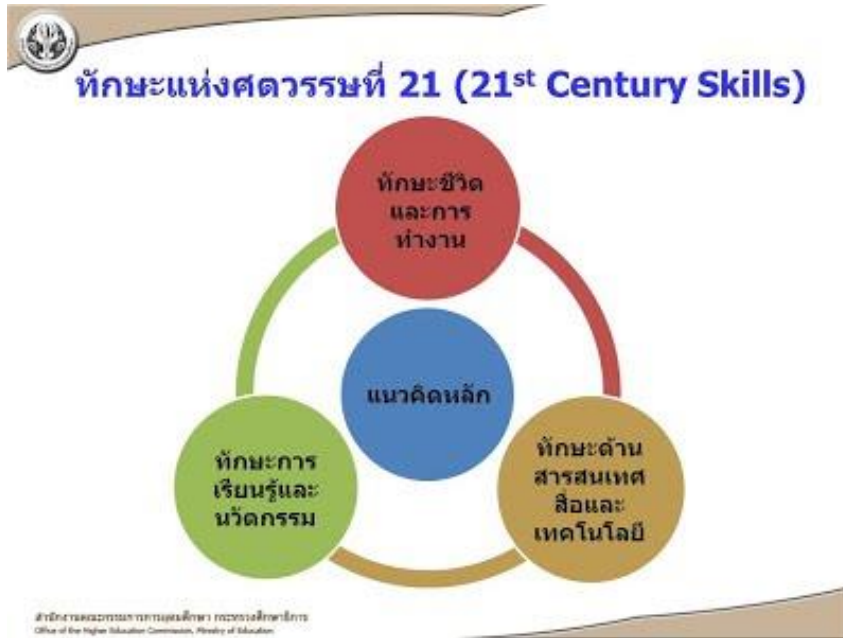
ภาพที่ 1 ภาพทักษะแห่งศตวรรษที่ 21

การประชุมวิชาการนำเสนอผลงานวิจัยระดับชาติและนานาชาติ ครั้งที่ 14 "Global Goals, Local Actions: Looking Back and Moving Forward 2021" วันพุธที่ 18 สิงหาคม 2564