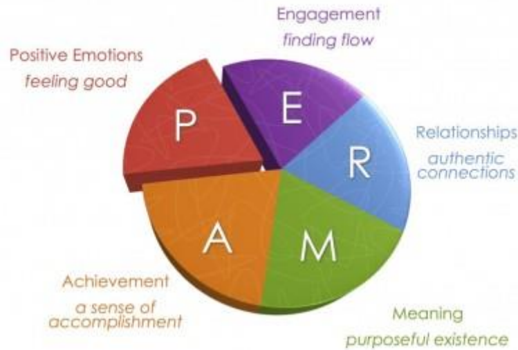
ภาพที่ 1 องค์ประกอบของจิตวิทยาเชิงบวก (PERMA Model)

ในแง่ของผู้เรียน 5 องค์ประกอบนี้ย่อมหมายถึงการที่ผู้เรียนมีความสุขกับการเรียน (P) มีความรู้สึกผูกพันหรือมีส่วนร่วมกับสิ่งที่เรียน (E) มีสัมพันธภาพที่ดีระหว่างผู้เรียนกับผู้สอนและระหว่างผู้เรียนด้วยกันเอง (R) รวมถึงรู้สึกว่าเป็นเจ้าของหรือสิ่งที่ตนเรียนอยู่นั้นมีคุณค่าความหมาย (M) และได้ใช้ความพยายามจนกระทั่งประสบความสำเร็จในแต่ละขั้นของการเรียนรู้ (A) จึงทำให้เกิดความรู้สึกภาคภูมิใจหรือเห็นคุณค่าในตนเอง