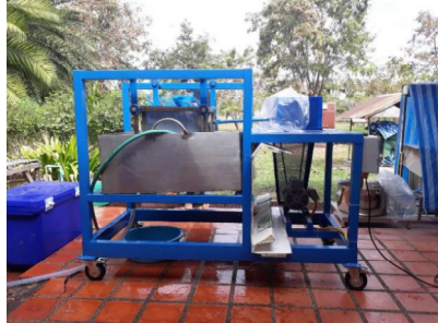
รูปที่ 2 เครื่องล้างเมล็ดงา

ขั้นตอนต่อไปเป็นการสร้างเครื่องล้างเมล็ดงา