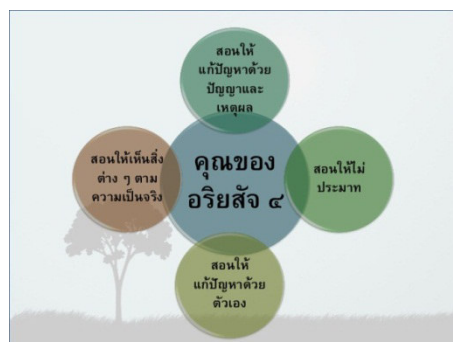
ภาพที่ 3 อริยสัจ 4